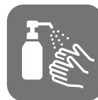
アルコール消毒 各所設置