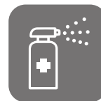
会場内 アルコール消毒