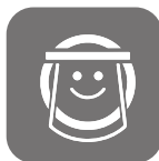
フェイスガード マスク着用